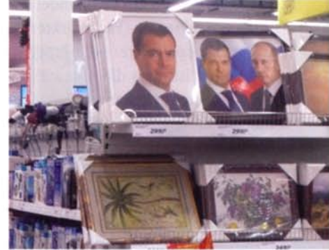
Staatstragend: Medwedew und Putin im Angebot bei Real.

Der Besitz eines Visums öffnet aber noch lange nicht ohne weitere Prüfung den Weg etwa in die Metropole Moskau. Es muss, wie es sich gehört, die Passkontrolle absolviert werden. Wer seit den Sowjetzeiten nicht mehr hier war, könnte den Eindruck gewinnen, dass hier die Zeit stehen geblieben ist.