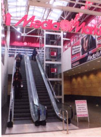
Ungewohnt: Media Markt in Magenta