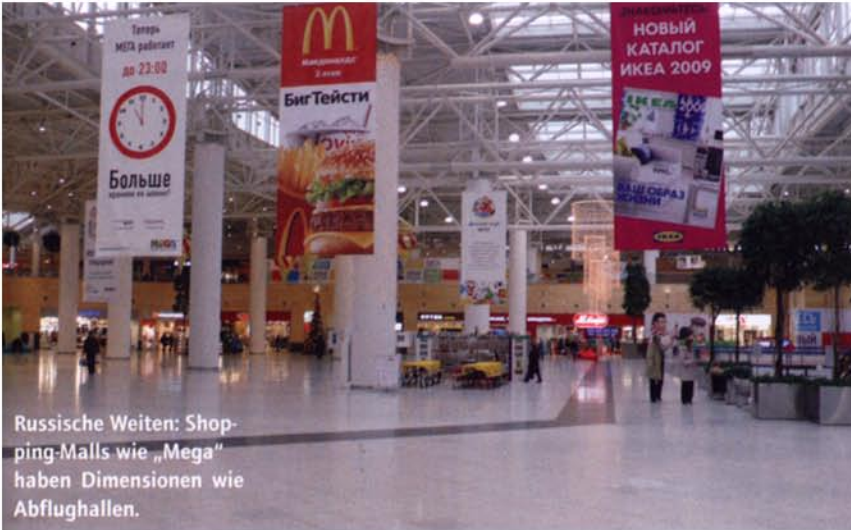
Russische Weiten: Shopping-Malls wie „Mega“ haben Dimensionen wie Abflughallen.

reisepapiere, dann der erlösende Knopfdruck. Auch wenn sich danach zwar nur eine kleine Tür öffnen lässt, hat der Einreisende nach dieser Prozedur den Eindruck, dass endlich das Tor in die russische Hauptstadt Moskau aufgeht. Wer mit Russland ins Geschäft kommen will, startet dieses Unterfangen sinnvollerweise zunächst in Moskau oder in St. Petersburg.